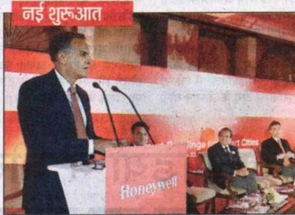
नई दिल्ली में मंगलवार को 'स्मार्ट शहरों के लिए स्मार्ट बिल्डिंग' पर सम्मेलन को सम्बोधित करते भारत में अमरीकी राजदूत रिचर्ड वर्मा।

About The Publication: Punjab Kesari Group is a Hindi-language newspaper published from many centres in Punjab, Haryana, Rajasthan, Himachal Pradesh and Delhi in India. It is owned by the Punjab Kesari group (The Hindsamachar Ltd.).